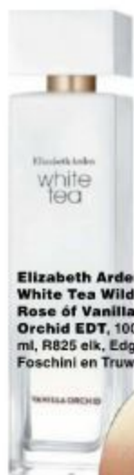
Elizabeth Arden White Tea Wild Rose of Vanilla Orchid EDT , 100 ml, R825 elk, Edgars, Foschini en Truworths

Ruik heerlijk wanneer jy The Body Shop Strawberry Body Yogurt aansmeer, R150