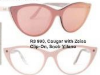
R3 990, Cougar with Zeiss Clip-On, Snob Milano

Behandel olierige probleemvelle met Noreva Exfoliac Anti-Imperfections BB Crème . Die getinte gesigroom absorbeer oortollige olie, bevochtig, verminder die verspreiding van onsuiverhede en laat jou vel egalig lyk. Beskikbaar in Light en Golden, R239,95