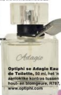
Optiphi se Adagio Eau de Toilette , 50 ml, het 'n aanteklike kontras tussen hout- en blomgeure, R787, www.optiphi.com