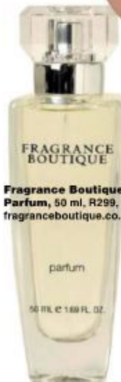
Fragrance Boutique Parfum , 50 ml, R299, www.fragranceboutique.co.za