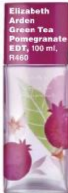
Elizabeth Arden Green Tea Pomegranate EDT , 100 ml, R460

SOLAL Oil to Milk-reiniger verander in 'n melkerige emulsie wanneer dit met water gemeng word en verwyder alle onsuiverhede op die vel, R209, beskikbaar by Dis-Chem en sekere apteke