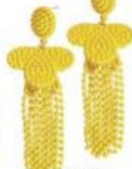
R39,99, Mr Price

essence Prime + Studio Mattifying + Pore Minimizing Primer sorg dat jou onderlaag eweredig aansmeer. Dit word vinnig geabsorbeer en word mat droog, R79,95, Dis-Chem