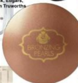
Viva la Diva Blushing Pearls of Bronzing Pearls gee 'n bietjie kleur aan jou gelaat, R175 elk, www.vivaladiva.co.za