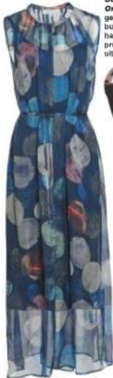
R1 399, Queenspark