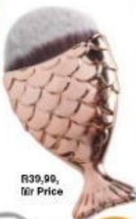
R39,99, Mr Price

FREEMAN Beauty Infusion Hydrating Cream Mask Manuka Honey + Collagen maak jou vel sag en veersterk elastisiteit, R149, Dis-Chem