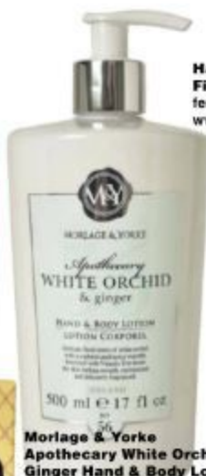
Morlage & Yorke Apothecary White Orchid & Ginger Hand & Body Lotion , R84,95, @home

Hannon Neck & Bust Firming Crème bevorder ferm vel en verskaf vog, R420, www.hannon.co.za