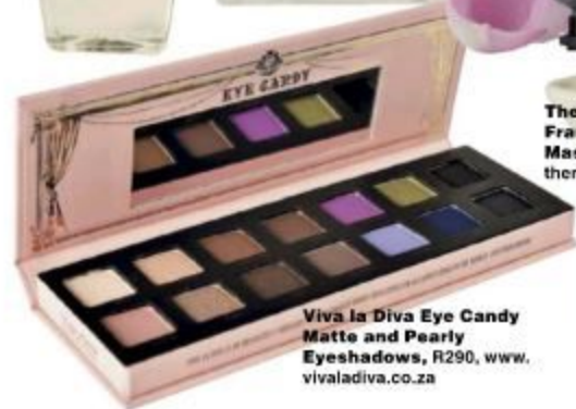
Viva la Diva Eye Candy Matte and Pearly Eyeshadows , R290, www.vivaladiva.co.za

TheraVine AromaVine Frangipani and Jasmine Massage Candle , R228, www.theravine.co.za en sekere salonne