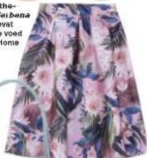
R169,99, Mr Price